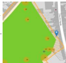
Localisation du bien

Les travaux consignés dans la demande n'auront pas d'incidence défavorable sur le site classé du parc Forestier. Bien que la lucarne créée en façade arrière, en fond de parcelle, soit perceptible depuis l'espace vert, elle est assez éloignée du parc et son impact visuel s'en trouve atténué par un écran vert. La demande n'appelle pas de remarques particulières d'ordre patrimonial et relève d'un examen urbanistique.