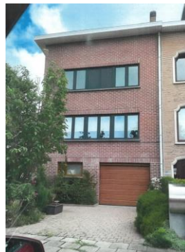
Photomontage – extr. du dossier

Le remplacement des menuiseries, qui fait l'objet de la demande, n'a pas d'impact négatif sur les perspectives vers et depuis le site classé situé en face de la maison. D'un point de vue architectural, il serait toutefois souhaitable d'harmoniser la teinte de l'ensemble des menuiseries extérieures, y compris celles du rez-de-chaussée, afin d'assurer la cohérence d'ensemble de la façade.