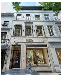
Façade avant Photo de la situation existante

En réponse à votre courrier du 04/03/2026, nous vous communiquons l'avis émis par la CRMS en sa séance du 18/03/2026, concernant la demande sous rubrique.