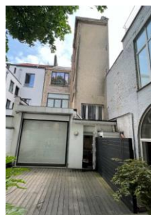
Façade arrière Photo de la situation existante