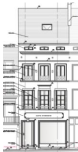
Façade avant Situation projetée