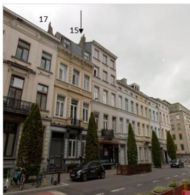
Photo de la situation existante et plan d'élévation projetée, extraits de la demande