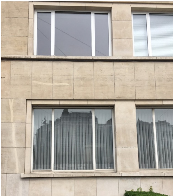
La différence de l'épaisseur des profils et du reflet du vitrage entre un châssis en acier d'origine (en bas) et un châssis en aluminium (en haut).

La CRMS estime que l'immeuble se caractérise essentiellement par sa valeur d'ensemble. Il témoigne aussi de valeurs architecturales indéniables, dont l'expression passe précisément par la qualité et la finesse de ses châssis en acier. La CRMS n'est donc pas favorable à un changement de l'aspect visuel des châssis actuels, c'est-à-dire à l'épaississement des profils (comparaison avec les châssis déjà remplacés au premier étage). Elle insiste pour que d'autres alternatives soient étudiées, dont en priorité le maintien des châssis existants en les adaptant pour leur amélioration thermique. Différents fabricants présents sur le marché proposent ce genre d'intervention.