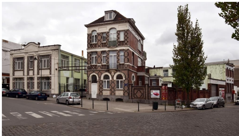
Rue Charles Demeer, 1-3 et rue Dieudonné Lefèvre, 75

En 1994, une demande d'inscription sur la liste de sauvegarde est introduite mais ne sera pas suivie d'une mesure légale.