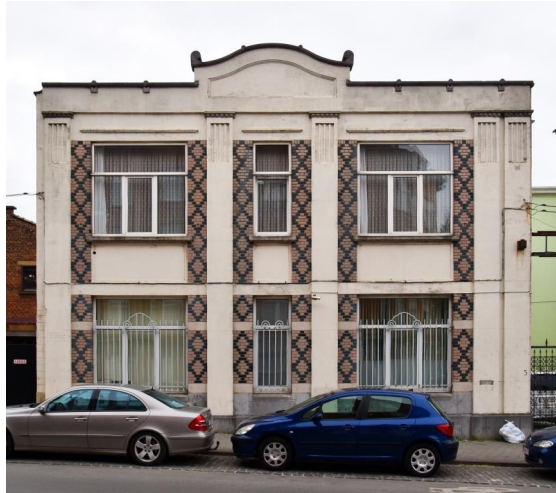
Rue Charles Demeer, 3