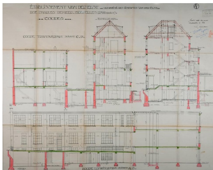
Plans de 1923

Construit par l'entreprise « Paul Hamesse/Frères/Architectes » selon des plans datés de 1923 pour les établissements Van Der Elst, le complexe se situe à l'angle des rues Charles Demeer et Dieudonné Lefèvre. Il comprend l'ancienne maison du directeur et un ancien bâtiment de bureaux/entrepôt qui s'étend en L le long d'une cour intérieure. En 1930, un bâtiment est ajouté rue D. Lefèvre et annexé parallèlement d'un entrepôt-garage. Un mur de clôture ferme en grande partie l'ensemble des bâtiments et une grille ferme la cour rue Ch. Demeer.