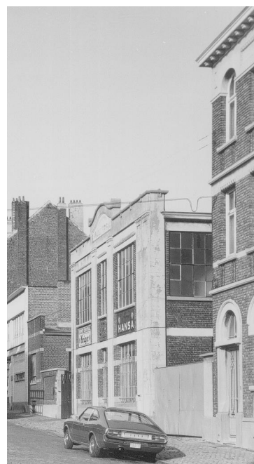
Rue Charles Demeer, n os 1 et 3 dans les années 1930