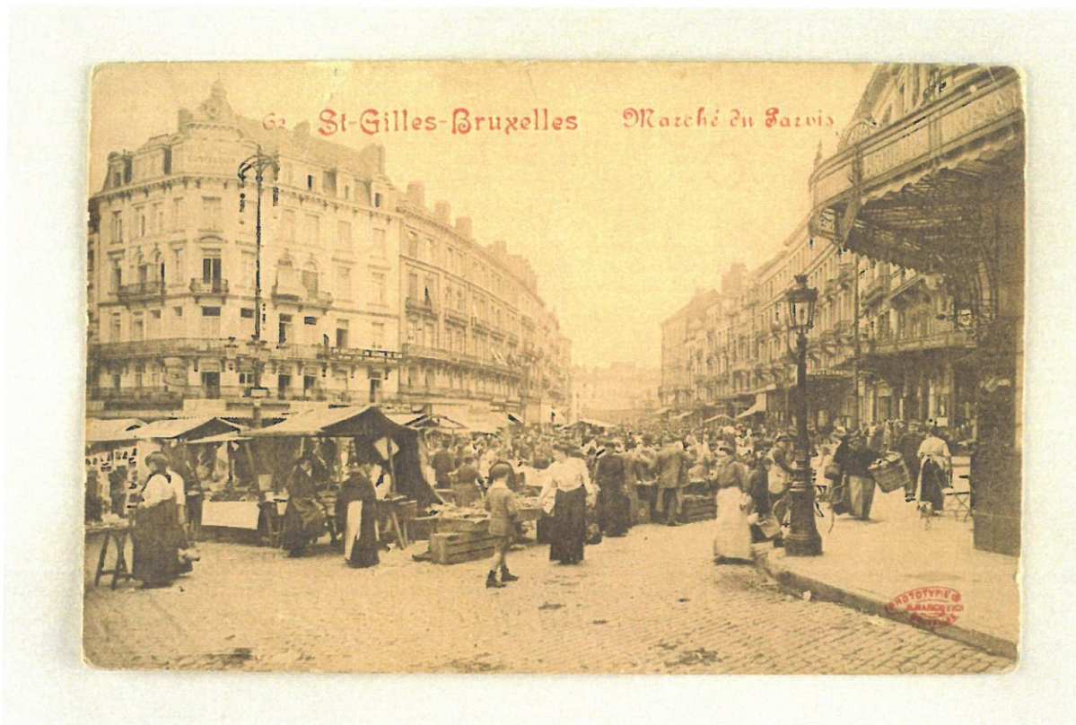
Collection cartes postales Dexia – Saint-Gilles © BUP-DPC

charpentes apparentes. Les modèles devront être des ouvrages de qualité qui s'assimilent à des tabatières anciennes (type cast). Enfin, la CRMS demande que les châssis dans les mansards soient à nouveau équipés de petits bois afin de rendre aux façades leur homogénéité d'origine et de permettre leur ouverture, comme illustré ci-dessous sur une ancienne carte postale.