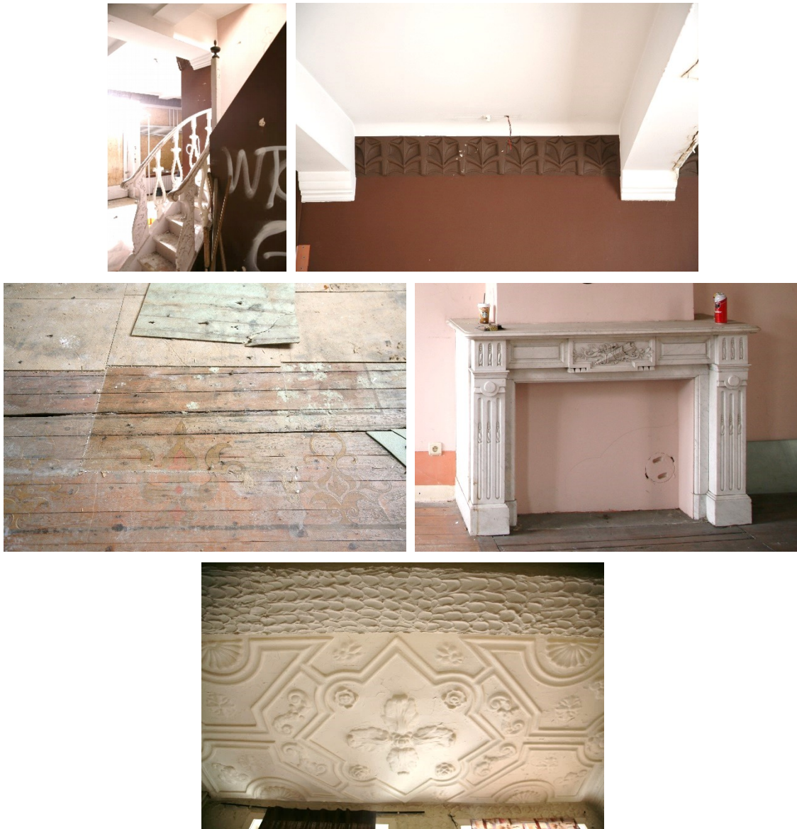
Fig. 2. Vue des éléments de décor intérieurs. © CRMS, 11 mars 2019.

Sur le projet en tant que tel, la Commission se prononce favorablement. Elle suggère toutefois la réalisation d'études complémentaires concernant certains éléments décoratifs intérieurs, pas ou peu documentés dans l'étude historique, tels que la cage d'escalier d'apparence XIX ème siècle avec ses balustres d'époque et un départ de rampe d'appui en forme de lanterne antique en bronze, la frise sous plafond de style néo-médiévaliste, le décor néo-médiéval (?) peint sur le parquet du 1 er étage et la cheminée de style Louis XVI en marbre blanc avec cartouche central à carquois rue des Alexiens ainsi que les moulures du XVIII e siècle (?) à rosaces et lys de France du plafond du 1 er étage rue Haute. Ces études devraient établir la valeur patrimoniale de ces éléments (datation, matérialité, etc.) et préconiser une attitude à leur égard.