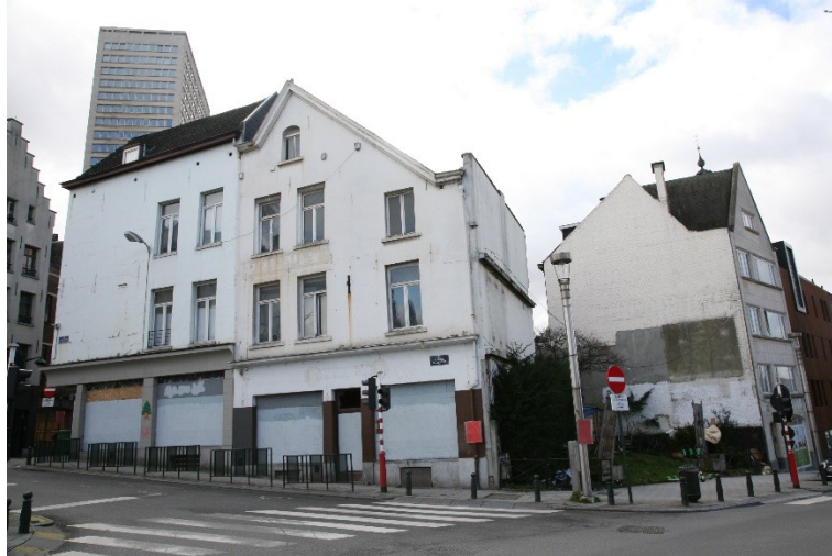
Fig. 1. Vue de l'angle entre la rue des Alexiens et le boulevard de l'Empereur. © CRMS, 11 mars 2019.