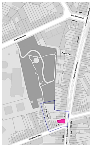
Fig. 1. Localisation du projet au sein de la zone de protection.

Le terrain visé par la demande se trouve dans la zone de protection de l'estaminet « Au Vieux Spijtigen Duivel », classé comme monument depuis le 22 avril 2010 et sis au n° 621 Chaussée d'Alseberg. Le projet touche par ailleurs le Carré Tillens, mentionné dans l'annexe à l'arrêté de classement. En effet, l'écurie de l'ancien relais routier, conservée dans le fond du jardin, « borde actuellement le carré "Tillens", une impasse bordée de maisons ouvrières datant des alentours de 1900. Ce petit lotissement ouvrier se développe le long d'une allée en pavé menant à des jardins qui, jusqu'il y a quelques années, étaient cultivés en potager ». L'impasse, en recul de la chaussée d'Alseberg et accessible par la rue Joseph Bens, compte cinq maisons (les n° 5, 6, 8, 9 et 10) inscrites à l'inventaire du patrimoine architectural de la Région de Bruxelles-Capitale ainsi qu'à l'inventaire du patrimoine social réalisé par La Fonderie en 2005.