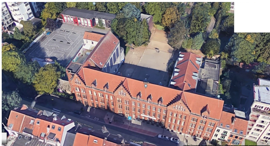
Vue de l'Institut Montjoie.

L'Institut Montjoie, anciennement École des Sœurs Fidèles Compagnes de Jésus, fut construit par l'architecte Georges Cochaux-Ségard à partir de 1904 dans le style néo-gothique, propre à l'architecture scolaire catholique. L'ensemble comprend plusieurs bâtiments scolaires et conventuels ainsi qu'une chapelle. Plusieurs extensions sont réalisées par l'architecte Douffet de 1926 à 1929 dans le respect du style, des gabarits et des matériaux de la construction initiale, dont la chapelle. La façade à rue, protégée, compte trois niveaux et 23 travées divisées en trois façades à pignon en escalier.