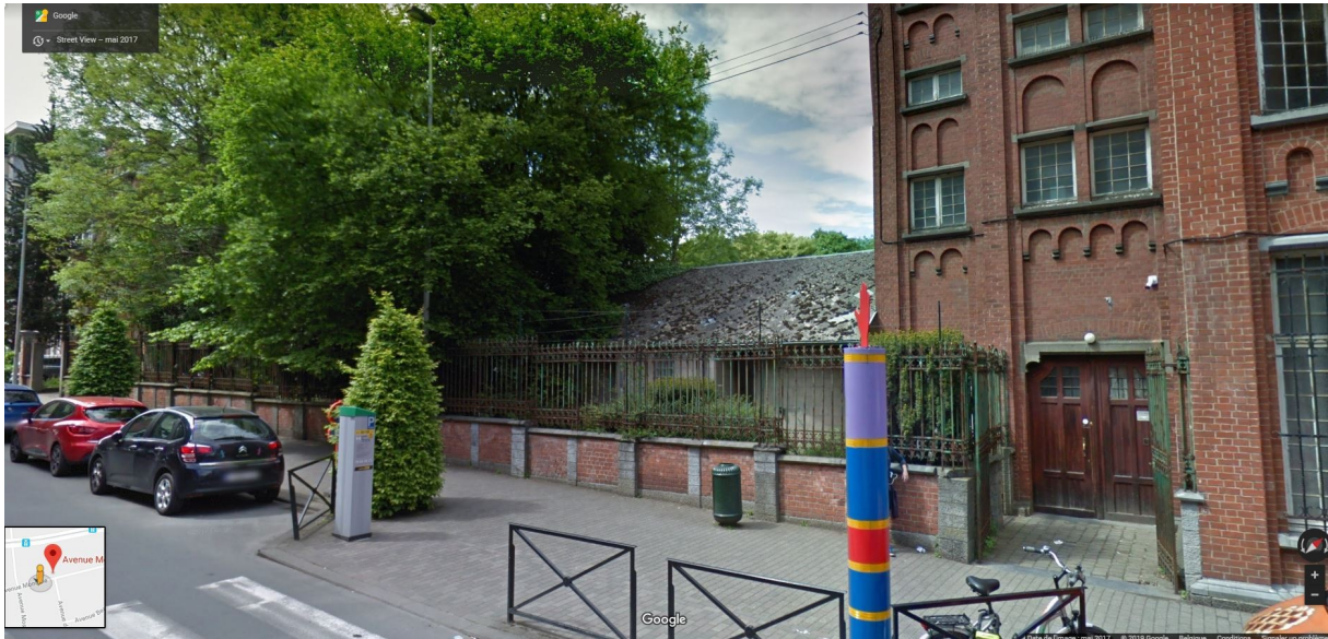
Le mur de clôture.

Enfin, le mur de clôture, qui se développe côté rue, à gauche de la longue aile protégée, n'est pas documenté dans la présente demande. Il constitue pourtant la suite logique de la longue aile à rue, s'accorde visuellement à son style et donne du sens au front bâti inscrit sur la liste de sauvegarde. Le projet prévoit d'entamer la partie du mur de clôture à hauteur du Pavillon IRSA, démolit et remplace pour une nouvelle porte grillagée avec accès SIAMU. La CRMS n'est pas favorable à cette intervention et demande d'intégrer, dans la mesure du possible, l'accès SIAMU dans le mur existant tout en récupérant un maximum d'éléments d'origine. Elle insiste sur une mise en œuvre soignée à la hauteur de la valeur patrimoniale du bâtiment protégé.