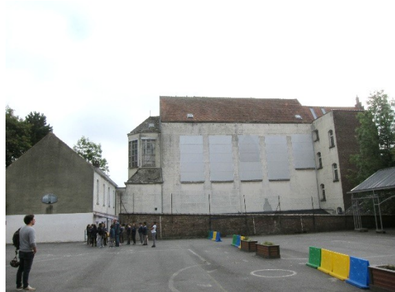
La chapelle réaffectée en salles de sport.