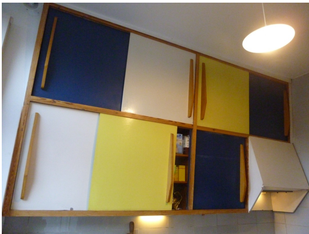
bovenkasten vandaag