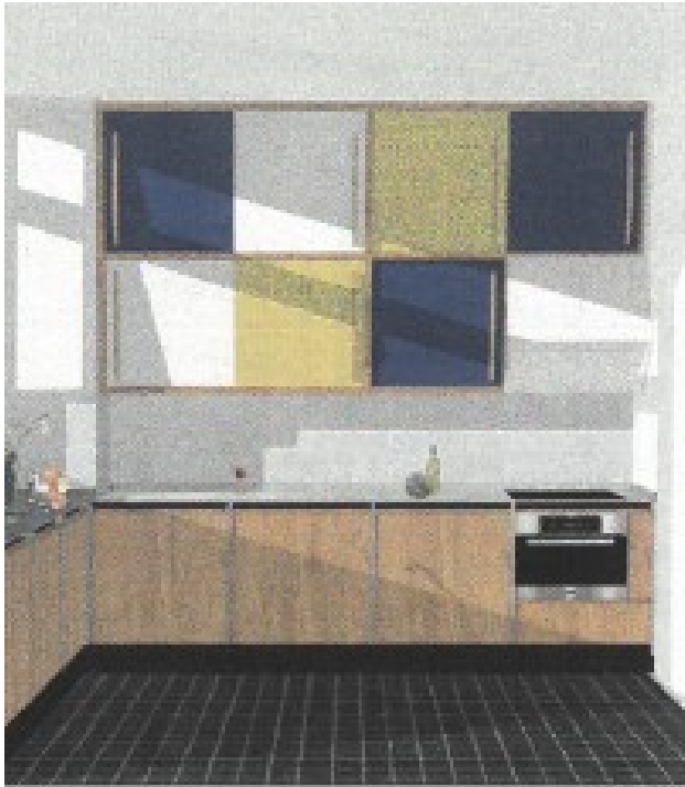
ontwerp nieuwe keuken © uittreksel dossier