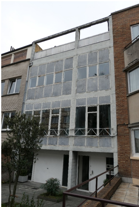
voorgevel 2018

Het interieur van de woning Moureau bleef bijzonder goed bewaard: de ruimten, het geïntegreerd meubilair en de decoratie bevinden zich nog haast in hun oorspronkelijke staat, wat eerder uitzonderlijk is voor woningen uit de jaren 1950. Aan de buitenkant onderging het huis enkele wijzigingen, vooral naar aanleiding van onderhoudswerken (schilderen van de straatgevel, recent houten raamwerk in de achtergevel, enz.).