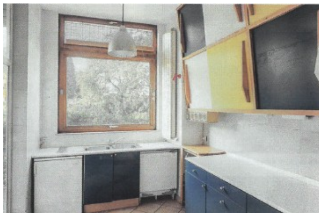
de keuken vandaag © uittreksel dossier