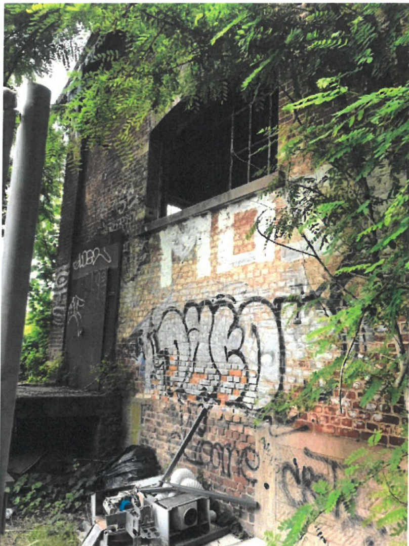
Hangar à marchandises gare Uccle-Stalle, façade arrière, 2019