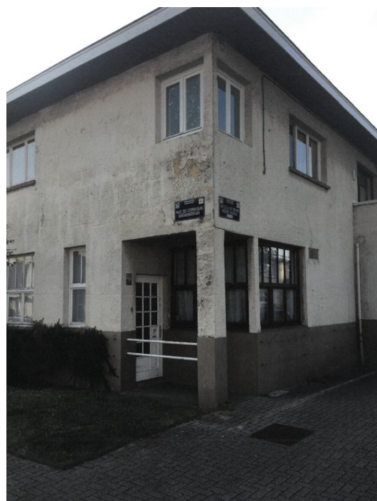
Vues diverses de la Cité Moderne