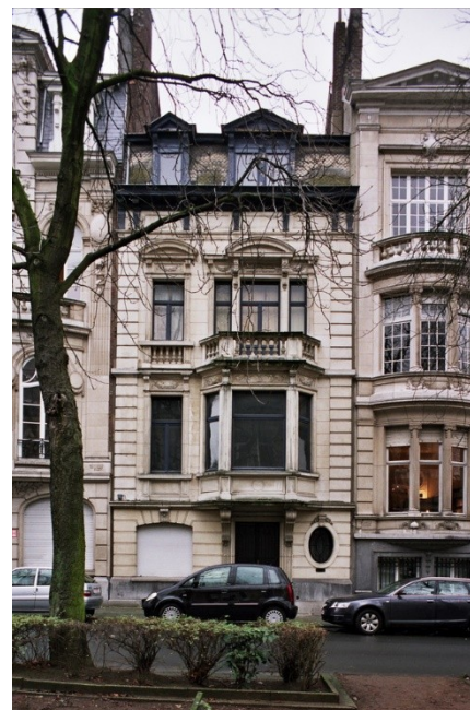
Fig. 1. Vue de la façade principale.

Façade en simili-pierre blanche rehaussée de pierre blanche, sur un soubassement en pierre bleue. Rez-de-chaussée à bossages, percé d'une fenêtre à arc surbaissé à agrafe, de la porte métallique dans l'axe et d'un oculus ovale barreaudé à agrafe décorée de fruits. Étages entre pilastres à bossages. En travée étroite, fenêtre sur allège à guirlandes et sous entablement. Au troisième niveau, fenêtre sous fronton courbe, à allège à balustres. Travée large avancée d'un bow-window trapézoïdal, servant d'assise à une terrasse ceinte de dés et de balustres ; triplet sous entablement à fronton courbe central. Frise de tables entre les consoles de la corniche. Mansarde percée de deux lucarnes inégales en bois sous fronton. Ferronnerie et menuiserie d'origine 1 .