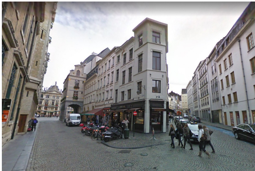
Vue sur le n°18 faisant l'angle avec la rue des Brasseurs