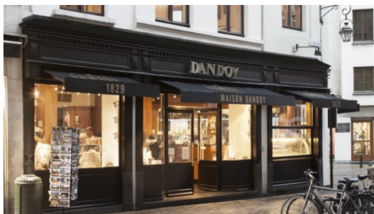
L'actuelle devanture