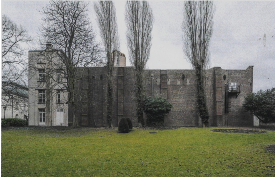
Fig. 2. Vue du mur aveugle de l'atelier Wiertz donnant sur le jardin/parc. Photo issue du dossier de demande d'avis préalable.

Pour finir, l'Assemblée s'interroge sur les intentions des instances européennes , futures occupantes de l'habitation, notamment au niveau des dispositifs de sécurité envisagés sur et autour du site, et sur leur impact pour le patrimoine. Elle exprime son souhait de voir les usagers du Musée et de la future « Maison européenne » cohabiter dans les meilleures conditions possibles en posant des choix tenant toujours compte de l'unité d'ensemble du bien et de sa valeur patrimoniale, tant pour ce qui concerne les parties classées que pour l'environnement urbanistique.