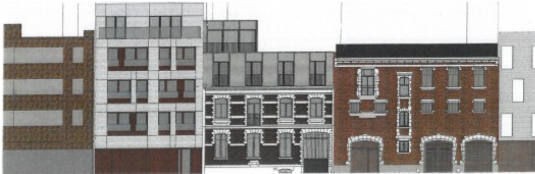
Projet de façade à rue, document joint à la demande de permis

supplémentaire). Cette option avait fait l'objet d'un avis de principe (défavorable) rendu par la CRMS en séance du 19/12/2018.