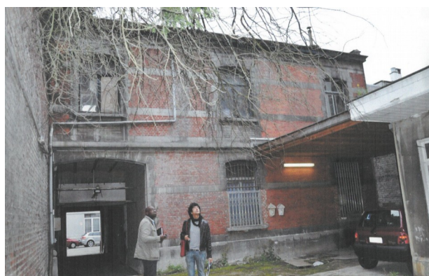
Ecuries, rue Lens 29 : plans d'archives et état existant © urban.brussels