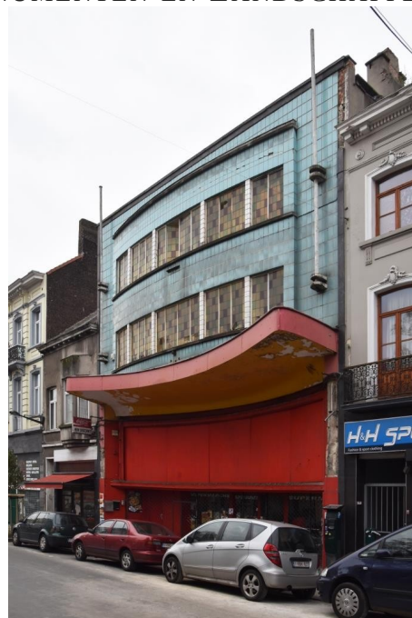
L'ancien cinéma Rio

À l'origine étaient bâties deux maisons de maître du 19 e siècle. Ces dernières ont été transformées à de multiples reprises : en 1914, réunion de ces maisons afin de créer le Cinéma Odéon ; en 1935, transformation de la salle en cinéma Rio ; et, en 1952-53 : « modernisation » par René Anjoux et François de Bond. C'est cette transformation qui est visée par le classement de 2010 car de grandes parties de cette modernisation sont préservées.