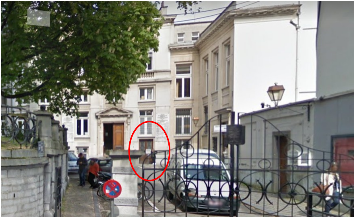
Entrée au pavillon Malibrans via l'impasse de la chaussée d'Ixelles. On peut y voir une double porte secondaire, de plain-pied avec l'impasse, à droite de l'entrée principale d'accès au pavillon

Elle a également évalué d'autres possibilités d'accès dont une sans doute plus conséquente à mettre en œuvre que la solution envisagée par la commune mais plus respectueuse du patrimoine à savoir l'installation d'un petit ascenseur dans un local technique situé à côté de l'entrée côté chaussée d'Ixelles et de plain-pied avec le trottoir, donnant accès à la salle des pas perdus du pavillon Malibrans et pouvant même être maintenu au-delà du chantier de l'îlot communal (car permettant dans le futur un accès direct au pavillon sans devoir traverser tout le complexe administratif).