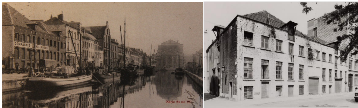
A gauche : photo du Quai au foin avant le comblement des bassins avec sur la gauche, l'entrepôt. A droite : Photo du bâtiment datée de 1978. Image tirée du dossier.

Situé à l'angle du Quai au Foin et de l'impasse des Matelots, le bien est un ancien entrepôt aux foins, abritant autrefois le dépôt de fourrage de l'Ancienne Compagnie Hollandaise. Datant de la première moitié du XIX e siècle, l'existence de ce dépôt à foin a pu être confirmée depuis 1841 1 . Constitué de trois niveaux dont un rez-de-chaussée bas à demi enterré, il présente, en façade avant, douze travées sous deux bâtières à croupes perpendiculaires. La façade latérale longeant l'impasse des Matelots est ajourée d'une travée axiale.