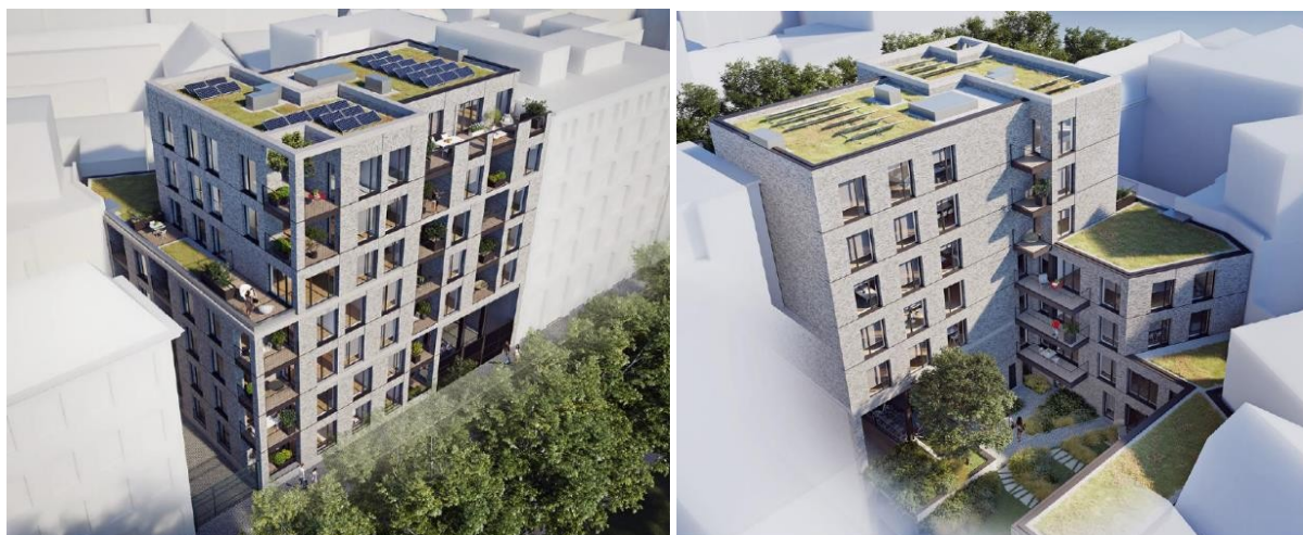
Ci-dessus : Photomontage du projet. A gauche, vue depuis le Quai au foin sur l'angle avec l'Impasse des Matelots. A droite, vue sur l'intérieur d'îlot créé. Images titées du dossier.

Le projet consiste en la démolition de l'ancien entrepôt et la construction d'un immeuble de 31 logements (répartis comme suit : 10 studios, 6 appartements une chambre, 8 appartements deux chambres, 4 appartements trois chambres et 3 maisons unifamiliales deux chambres), d'un parking souterrain de 22 places et de l'aménagement d'un jardin à l'arrière en intérieur d'îlot. Le nouveau bâtiment est un R+6 avec un retrait du côté de l'impasse des Matelots et un retrait partiel sur le quai au Foin pour suggérer la continuité de la hauteur de corniche avec le bâtiment voisin. Il est pourvu de toitures vertes extensives. Le jardin est constitué par une toiture végétalisée sur parking et d'un bac 4m 2 de pleine terre pour la plantation d'un chêne Rouvre.