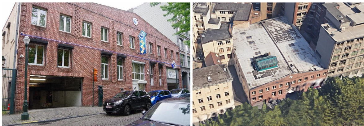
A gauche : Vue actuelle de l'entrepôt depuis le Quai au Foin. Image tirée du dossier.