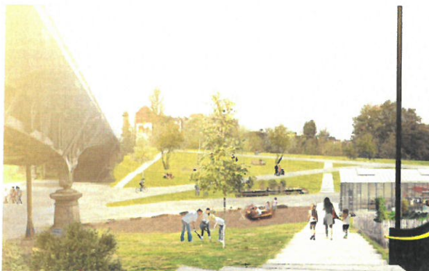
Image de synthèse extraite du dossier de demande

La présente demande de permis porte sur l'aménagement de la partie du Parc de Tour & Taxis qui est située entre le boulevard du Jubilé et l'avenue Jean Dubrucq ainsi que sur la création de deux nouveaux accès définitifs au parc de Tour & Taxis, l'un depuis le pont du Jubilé classé, l'autre depuis le pont Clesse (avenue Jean Dubrucq à Molenbeek). Il répond pour grande partie aux remarques formulées par la CRMS dans son avis de principe, notamment en ce qui concerne le nombre d'accès au parc (limité à deux) et les interventions qui touchent au pont classé.