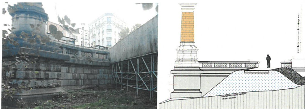
Photo et coupe extraits du dossier de demande

La Commission émet un avis conforme favorable sur ces travaux. Elle demande cependant d'inclure dans cette phase de travaux la restauration de l'ensemble de la balustrade en pierre du pont . Dans ce cadre, elle attire l'attention sur le fait que les balustres en pierre du pont Clesse semblent très similaires (ou identiques ?) à ceux du pont du Jubilé. Le cas échéant (à vérifier en détail), les balustres démontés du pont Clesse pourraient éventuellement être récupérés pour compléter la balustrade du pont du Jubilé. Il convient, en outre, pour ce point, de compléter le plan avec la zone de reprofilage du terrain (dans le dossier, ce reprofilage est seulement indiqué sur la coupe).