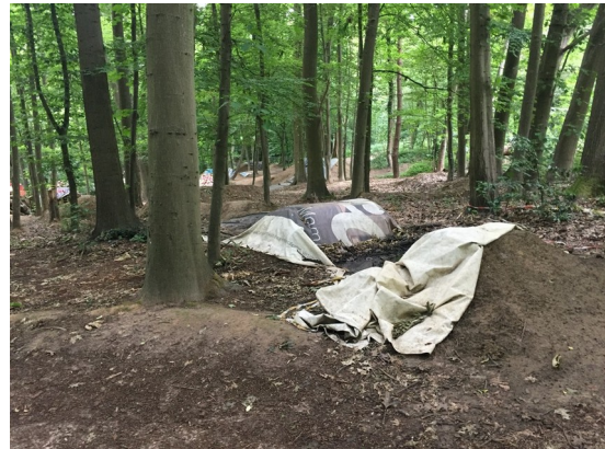
Fig. 9 et 10 : vues d'ensemble du Dirt Bike. La végétation de sous-bois est réduite à sa plus simple expression.

En complément de ces trois grandes zones ludiques, deux zones d'accueil seraient placées au niveau des entrées principales du site alors que l'annexe 10 en localise trois. Ce point devrait être clarifié.