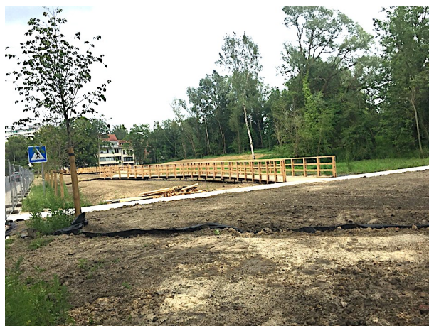
Fig. 5 : Le « Jardin de pluie » long de la chaussée de Saint-Job