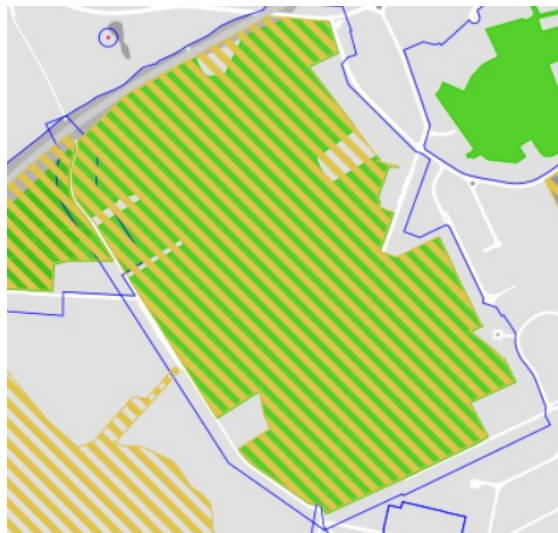
Fig. 1 : en traits hachurés verts : le site classé, en traits hachurés jaunes : le site Natura 2000, en bleu : la zone de protection

Le site du Kauwberg, de 35 ha, a été classé comme site semi-naturel le 27 mai 2004 car il présentait des intérêts paysagers (zones ouvertes et fermées, paysages ruraux, chemins creux, relief), scientifiques (biodiversité) et historiques (ancienne borne, ancienne carrière de sable). Le site a ensuite été classé en partie Natura 2000 et racheté par la Régie Foncière en 2018, qui l'a confié à Bruxelles Environnement qui souhaite organiser sa gestion, le site ayant longtemps été utilisé, voire aménagé, par les riverains sans autorisations. Il est actuellement en grande partie fermé pour des raisons de sécurité en attente d'aménagement.