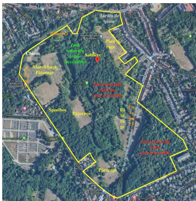
Fig. 4 : vue Google annotée par la CRMS (à superposer à la fig. 3)