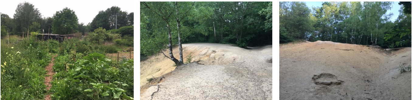
Fig. 6 : aspect général de la parcelle de potagers proche de la ligne de chemin de fer, production « extensive » de légumes sans nier son intérêt pour la biodiversité.