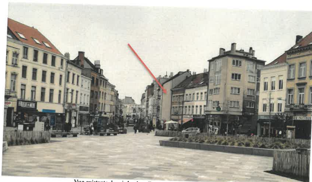
Vue existante depuis la place Fernand Cocq (extr. de la demande)

La demande porte sur la réalisation d'une fresque, à l'initiative du Collège des Bourgmestre et Echevins de la commune d'Ixelles, sur un mur latéral visible depuis l'espace public, se situant en léger débordement par rapport à l'alignement des maisons voisines et étant l'immeuble qui amorce le goulot de la chaussée d'Ixelles depuis la place Fernand Cocq. L'immeuble, sans intérêt patrimonial particulier, accueille un commerce au rez-de-chaussée et des appartements aux étages. Cette partie de pignon n'est ouverte qu'au rez-de-chaussée pour l'accès aux logements, le reste de l'élévation étant aveugle et recouverte d'un cimentage/enduit gris.