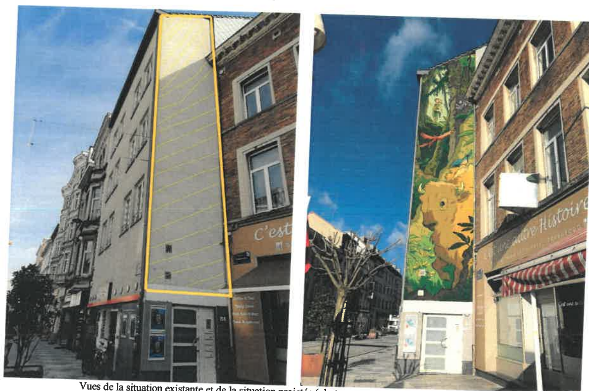
Vues de la situation existante et de la situation projetée (photomontage, extr. du dossier de demande)

La demande porte sur la réalisation d'une fresque, à l'initiative du Collège des Bourgmestre et Echevins de la commune d'Ixelles, sur un mur latéral visible depuis l'espace public, se situant en léger débordement par rapport à l'alignement des maisons voisines et étant l'immeuble qui amorce le goulot de la chaussée d'Ixelles depuis la place Fernand Cocq. L'immeuble, sans intérêt patrimonial particulier, accueille un commerce au rez-de-chaussée et des appartements aux étages. Cette partie de pignon n'est ouverte qu'au rez-de-chaussée pour l'accès aux logements, le reste de l'élévation étant aveugle et recouverte d'un cimentage/enduit gris.