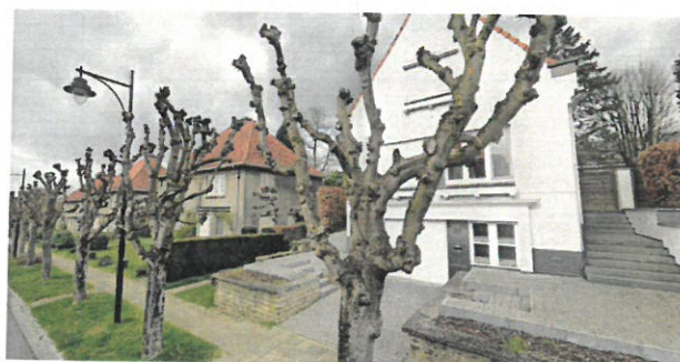
Vue de 2009 sur les abords classés de la maison avant réaménagement / vue de 2019 sur les mêmes abords après les travaux de réaménagement.