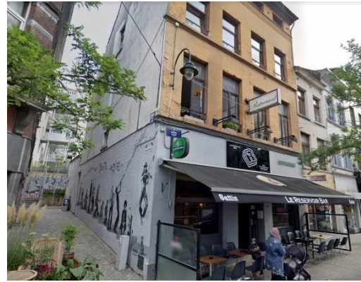
Vue de l'immeuble en 2019.

Il s'agit d'une maison de commerce et d'habitation de style néoclassique de quatre travées, caractéristique du début du XIX ème siècle. Dans le dossier, aucun élément ne s'intéresse à l'origine et à l'évolution du bien, qui appartient pourtant au patrimoine traditionnel de la rue Haute et, plus largement à celui du quartier des Marolles. L'immeuble est bordé par la petite rue de l'Éventail qui constitue un accès aux logements sociaux de la rue des Minimes.