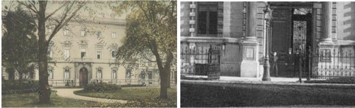
Vue du square côté rue de la Science

en fer forgé (et colonnes en fonte) ornementées de volutes et motifs floraux. Le square est accessible des quatre côtés de la place. Deux statues ont été ajoutées depuis sa création modifiant les grilles, à savoir le monument de Frère-Orban en 1900 (date à laquelle la place changea de nom) par C. Samuel et celui de Gendebien, juriste et homme politique libéral de la toute jeune Belgique, par C. Van Der Stappen en 1874. Implanté à l'origine place de la Justice puis à la place Gendebien, le monument fut installé en 1957 au square Frère-Orban. Les grilles furent transformées (suppression d'ouvrants) pour offrir un passage plus large. Au centre du square se trouve aussi un monument commémoratif « l'Enclos des treize colonels » de R. Pechère et J.M. Morant.