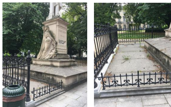
Détail des bordures et dalles en pierre bleue ainsi que des grilles basses devant la statue Frère-Orban (© Urban-DPC, juin 2020)

Aux endroits où reposeront les nouvelles grilles fixes, le soubassement en pierre bleue existant (intervention des années 1950) sera démonté et remplacé par une reproduction à l'identique du soubassement en pierre bleue des grilles d'origine. Autour du monument, de nouvelles pierres plates seront placées formant un pavement en s'inspirant de la situation au pied du monument Frère-Orban.