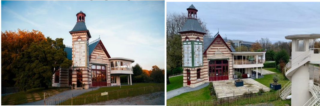
Vue des deux terrasses depuis les gradins de la grande terrasse - et de la balustrade en fer forge démontée et remplacée