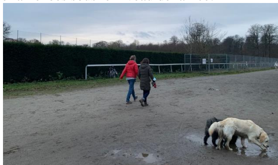
Vue de la haie située en bordure du golf, face à la grande tribune (©CRMS, déc. 2020)

Veuillez agréer, Madame la Directrice Générale, Monsieur le Directeur, l'expression de nos sentiments distingués.