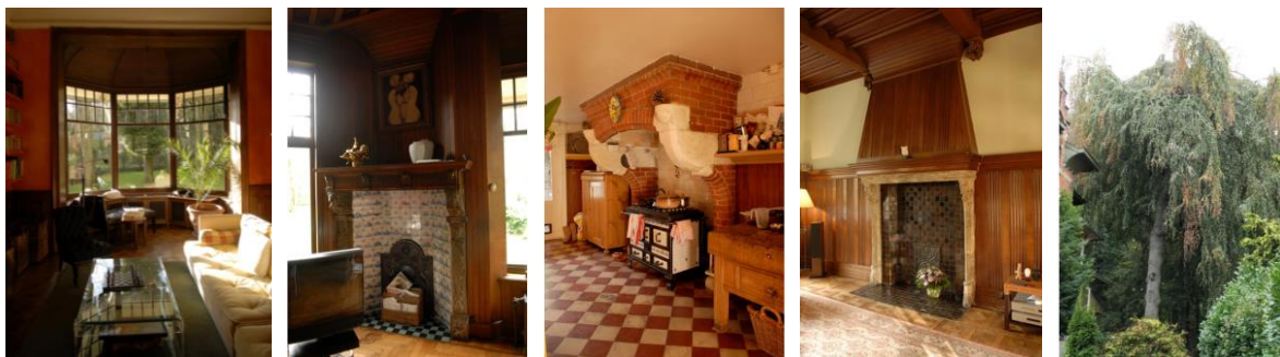
Photos extraites du dossier. A droite, vue du hêtre pleureur en 2019

La villa Schovaers témoigne également de manière remarquable et originale du style éclectique tendant vers la néo-Renaissance flamande et teinté d'Art nouveau, auxquels se mêlent des accents pittoresques proches du genre du cottage anglais. L'intérieur présente encore son organisation et sa décoration raffinée d'origine, qui reprend lui aussi ce mélange de styles : intégrant des décorations et finitions de diverses influences, il utilise en même temps de nombreux éléments de réemploi, dont certains proviendraient de l'ancien couvent des Petits-Carmes à Bruxelles.