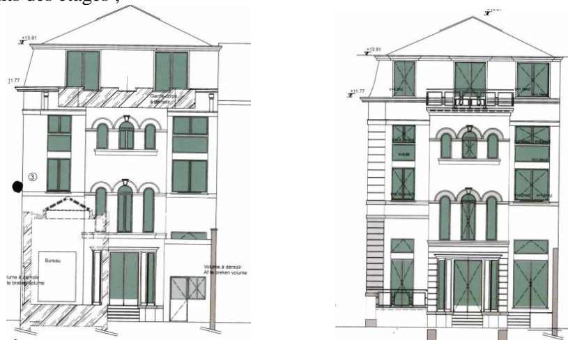
Ci-dessus : vue de la situation existante et de la situation projetée de la façade latérale de l'hôtel néoclassique. Image tirée du dossier.