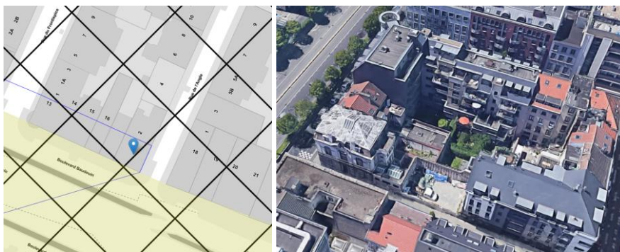
Situation du bien sur Brugis et vu aérienne de la situation actuelle

Le bien au n°2 de la rue de l'Angle est situé dans la zone de protection des Établissements Blum, situés 50 rue des commerçants. Le bien est repris à l'inventaire du patrimoine architectural 1 . Il est situé en ZICHEE au PRAS et le long d'un axe structurant.