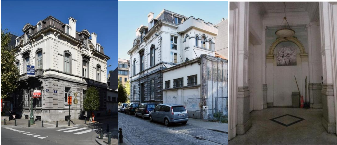
A gauche : Vue de l'immeuble néoclassique depuis l'angle avec le Boulevard Baudouin. Photo : monument.heritage.brussels Au centre : Vue de la façade latérale de l'immeuble néoclassique depuis la rue de l'Angle. Photo : monument.heritage.brussels A droite : Vue d'une partie des décors intérieurs encore en place au rez-de-chaussée. Photo tirée du dossier.

ajouts ultérieurs avec récupération du mur de clôture originel. L'intérieur présente encore quelques beaux éléments de décors néoclassiques au rez-de-chaussée (marbre, stucs, boiseries) mais a subi de nombreuses transformations dans les autres espaces.