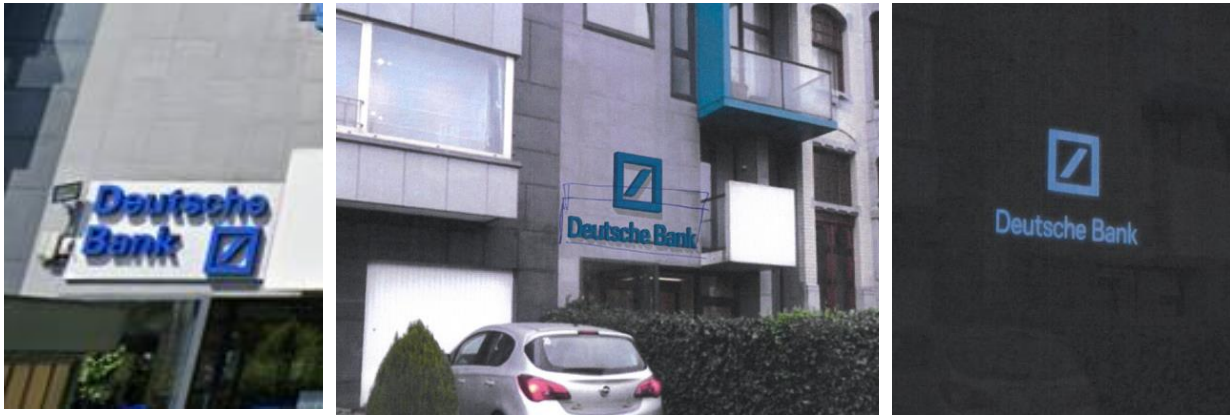
Logo actuel.

La demande vise le remplacement du logo actuel de Deutsche Bank par un nouveau logo, plus grand et sans fond blanc. Ce dernier sera équipé d'un système nocturne.