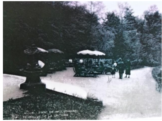
Etat pendant l'Entre-deux-Guerres et, en haut à droite, état des années 2000 (?)

La Commission demande de profiter des travaux actuellement programmés pour revaloriser ces caractéristiques, mises à mal par les aménagements récents ayant fragmenté cette partie du parc. Elle demande donc de réorienter le projet en ce sens, fondé sur des recherches historiques complémentaires et sur une analyse paysagère, menée en collaboration avec un architecte-paysagiste. En attendant, la CRMS formule les remarques suivantes sur l'avant-projet et demande de :