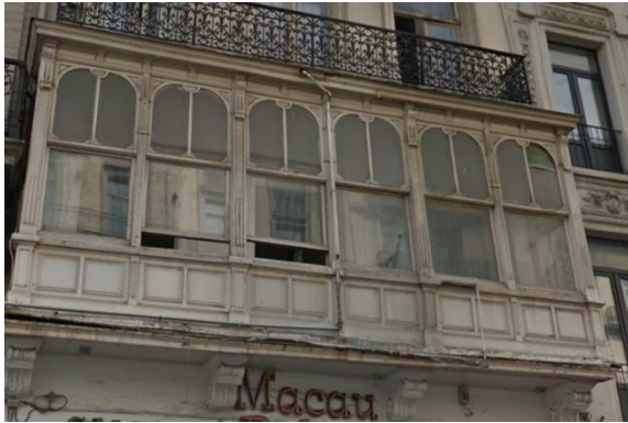
Détail du bow-window rue Orts, 3

Tout en approuvant les grandes lignes du projet, la CRMS formule les remarques et recommandations suivantes sur le projet :