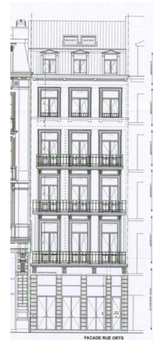
Elévation rue Orts, 3 – extrait du dossier de demande

La CRMS constate par ailleurs sur les documents graphiques, que l'entièreté des balcons seraient désormais équipés de garde-corps très banals qui constitueraient un appauvrissement de la façade. Les garde-corps des étages supérieurs sont de très belle qualité. En aucun cas ces éléments ne peuvent être supprimés ou remplacés par des nouveaux modèles. Il convient de les restaurer dans les règles de l'art. Les éventuels nouveaux éléments devraient aussi reprendre le modèle historique.