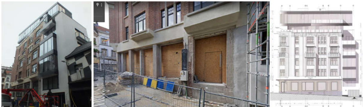
Vues pendant les travaux en 2020 - Élévation de la façade rue des Capucins (extr. du dossier de demande)

Les travaux étant déjà en grande partie réalisés, la demande actuelle porte sur divers aménagements par rapport au permis délivré, notamment sur des modifications intérieures, sur la mise en place d'un nouvel auvent en ferronnerie au lieu de sa restauration telle qu'envisagé dans un premier temps et sur des changements dans le garde-corps et le mur-rideau de la surhausse.