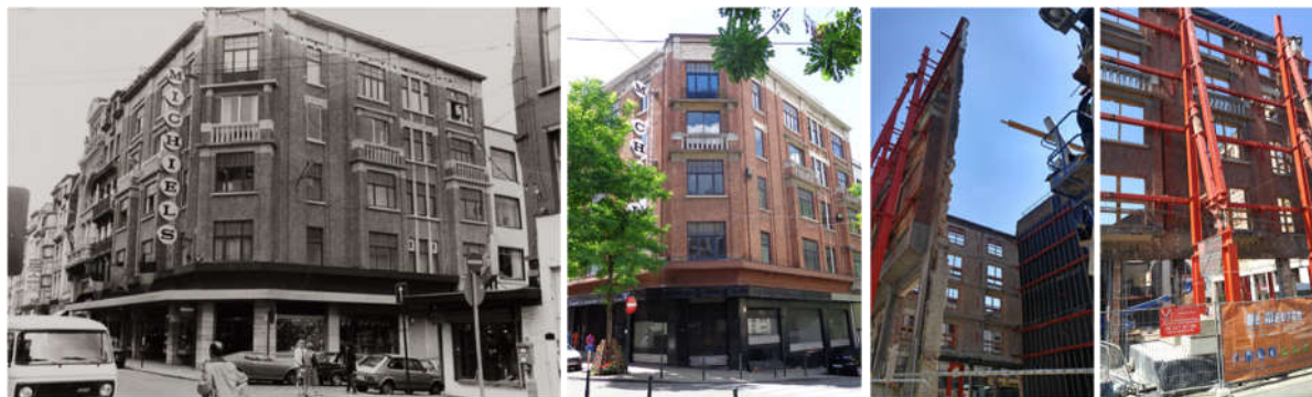
Vues des établissements Michiels avant travaux (©Urban, 1980 et 2015) et pendant les travaux en 2017 (©CRMS)

Les anciens établissements Michiels se situent dans la zone de protection de l'Institut Diderot – Athénée Funck - André sis rue des Capucins, 54-58, et dans la zone de protection du Palais Minerve (ancien cinéma Rialto) sis rue Haute, 205, tous deux classés comme monument. Cet imposant bâtiment d'angle de style Art déco construit en 1928-29 par l'architecte J. Michaut est inscrit à l'Inventaire du Patrimoine architectural de la région de Bruxelles-Capitale.