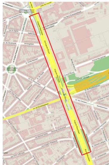
Extrait du dossier