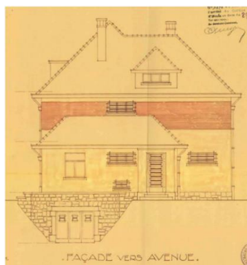
© Elévation avant, 1935 (archives communales d'Uccle 9470)