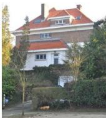
© Façade avant (extrait du dossier)

En réponse à votre courrier du 11 mars, reçu le 12 mars 2021, nous vous communiquons l'avis défavorable formulé par notre Assemblée en sa séance du 31 mars 2021.