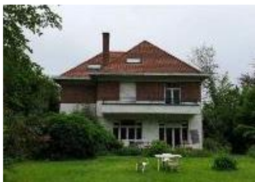
© Façade arrière (extrait du dossier)

La demande vise la démolition de la villa et la construction d'un immeuble de cinq appartements. La villa est de style pittoresque teintée de modernisme érigée en 1936 par Michel Polak en collaboration avec Alfred Hoch, qui est son principal collaborateur à partir de 1917, pour le compte de Monsieur Charles Bourtembourg, beau-père Théo Fleischman (journaliste belge et directeur de l'INR dès 1937)