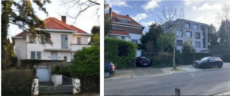
A gauche : le n°43 avant démolition. A droite : le n°43 après reconstruction. On y aperçoit aussi le n°45, pendant du 43 démoli (extraits du dossier)

également commanditaire de la villa voisine, le n° 43. Les deux villas seront construites en même temps, dans le même esprit et dans un souci de dialogue et de continuité architecturale et stylistique (toitures à versants, soubassements en moellons de grès abritant les garages, éléments de ferronnerie moderniste sur les portes d'entrée et les balcons extérieurs, contrastes entre les larges bandeaux de briques rouges sous les corniches et le crépi clair appliqué sur le reste des façades). La parcelle comprend également plusieurs arbres remarquables.