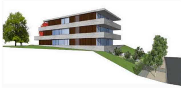
Projet d'immeuble de 5 appartements : 4 niveaux dont 1 semi-enterré, larges terrasses en façades, toitures plates (extrait du dossier)

En conclusion, étant donné que la réalisation du projet entraînerait non seulement la perte d'une belle villa de Michel Polak mais porterait également atteinte à la cohérence de ce tronçon de l'avenue Hamoir, la Commission s'y oppose. Elle demande de préserver et de remettre en valeur la maison.