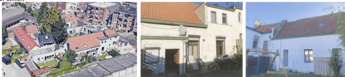
Vues actuelles de l'ensemble (©Google maps), des façades avant et arrière (extr. du dossier de demande)