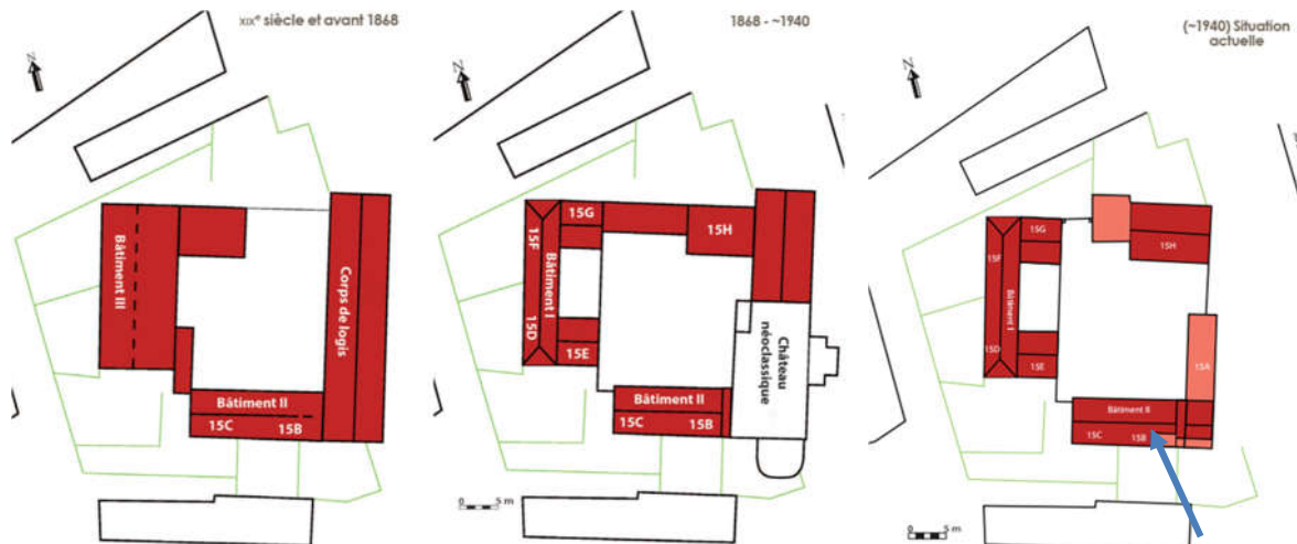
Evolution des bâtiments de l'ancienne ferme (extr. du Rapport archéologique), du 19 e s. à aujourd'hui. La flèche bleue précise l'emplacement des interventions projetées.

En raison des mutations successives – graphiquement résumées ci-dessous –, l'ensemble affiche actuellement une allure très hétérogène, sans vision générale pour le réaménagement de chacune des propriétés individuelles.