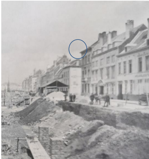
Extrait photo historique publiée dans HENNE, A. et WAUTERS, A., Histoire de la Ville de Bruxelles , 1845.

La CRMS se prononce favorablement sur les grandes lignes du projet. Elle estime cependant que certaines interventions en façade devraient être revues afin de mieux s'intégrer à l'architecture néoclassique des immeubles concernés ainsi que du tissu urbain dans lequel le projet s'inscrit. Il s'agit notamment des points suivants :