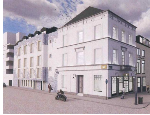
Photomontages des façades projetées-extraits du dossier de demande