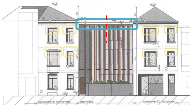
Etat actuel des façades et schéma d'implantation des écrans solaires joint à la demande