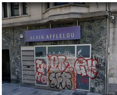
Situation existante