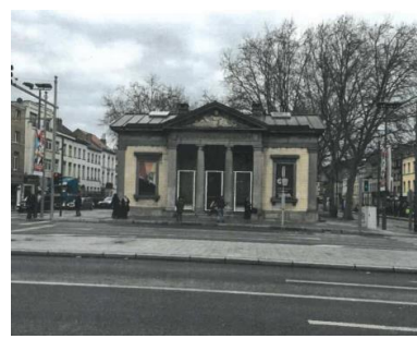
Vue d'un Pavillon en 2020.