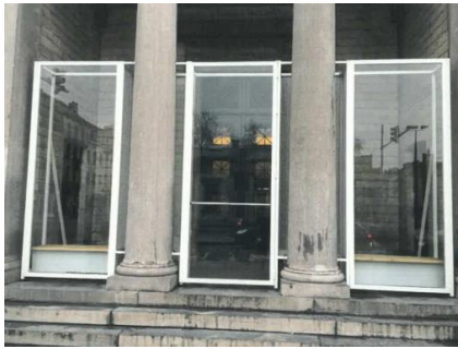
Vue des installations.

La structure est restée en bon état depuis son installation en novembre 2019.