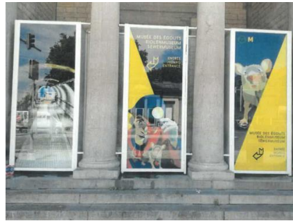
Panneaux publicitaires du musée appliqués aux vitres