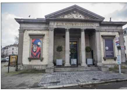
Vue d'un Pavillon en 2017.