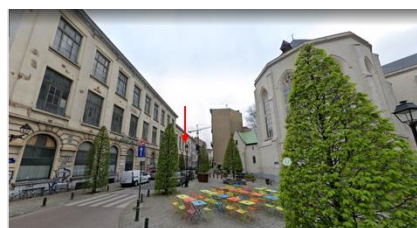
Plan de façade avec indication du panneau, joint à la demande et vue sur la façade concernée

S'agissant d'un panneau de chantier temporaire et important par rapport à l'aspect participatif de cette opération, la CRMS se prononce favorablement sur la demande. L'installation étant envisagée en façade d'une aile secondaire du complexe scolaire donnant dans la rue de l'Athénée, son impact visuel sera d'ailleurs peu préjudiciable aux perspectives sur l'église classée.