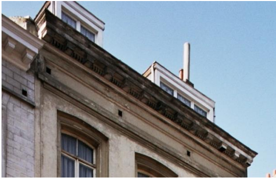
Détail de la corniche existante du n°27 – © urban.brussels

La CRMS n'est pas opposée au principe de la modification de la toiture de la maison sise au n°27 ni à une augmentation de volume pour améliorer l'habitabilité des combles pour autant que l'homogénéité du front bâti ainsi que les caractéristiques de l'architecture néoclassique de la maison soient mieux respectés. Etant donné que le projet ne répond pas à ces critères, la CRMS se prononce défavorablement sur la proposition actuelle, notamment pour ce qui concerne la partie avant de la toiture, visible depuis la rue. La Commission s'oppose tout d'abord fermement à la suppression de la corniche existante qui constitue un élément de qualité de la maison caractéristique de l'architecture néoclassique. Elle demande de la préserver et de la restaurer.