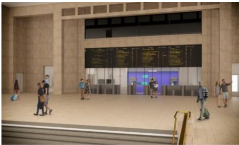
Figure 15 - Façade des guichets - proposition 3

Un maximum d'éléments en pierre des guichets existants seraient conservés. Cela conduit à la création de trois accès à porte simple automatique.