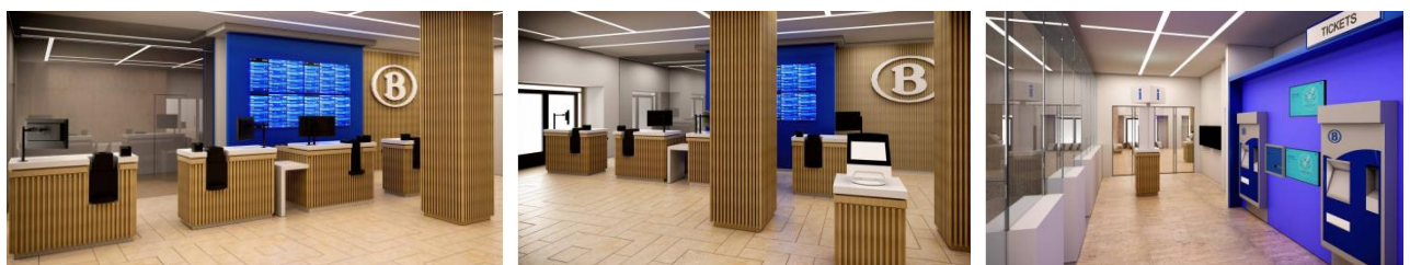
Simulation du nouveau Travel Center (extraits du dossier)