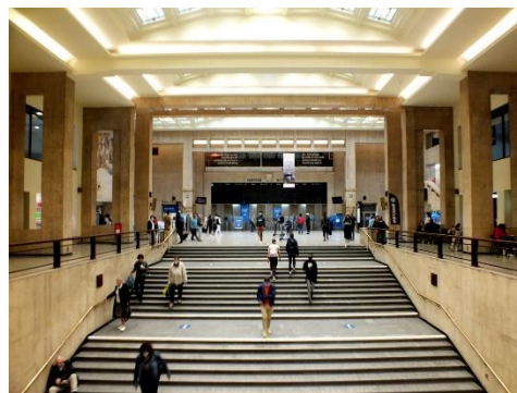
Vue de la salle des guichets et de l'escalier monumental (archive de 1952 extraite du dossier et photo CRMS juillet 2021)