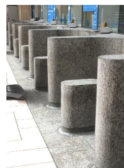
Au centre : vue d'un passe-billets. A droite : l'enfilade des guichets en granit du Tessin