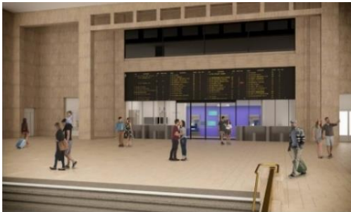
Figure 14 - Façade des guichets - proposition 2

Dans cette proposition sont conservées les parties en pierre de quatre guichets (deux guichets de part et d'autre de la nouvelle entrée). Ces guichets ne seraient plus utilisés.