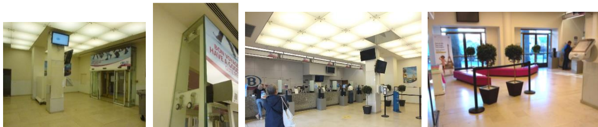
Vues du Travel Center actuel en septembre 2020 et en juillet 2021

A la Gare centrale de Bruxelles, la SNCB souhaite réunir le Travel Center actuel (ci-dessus en vert) et l'espace existant à l'arrière des guichets (rouge) et les transformer en une nouvelle zone de vente avec accueil et self-service (bleu ciel).