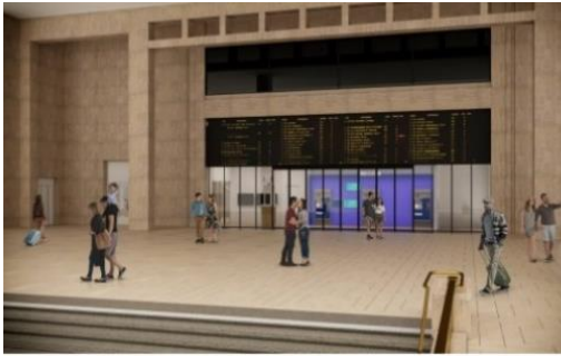
Figure 13 - Façade des guichets - proposition 1

Le parti de cette proposition consiste à supprimer les sept guichets et à les remplacer par une grande paroi vitrée et deux doubles portes automatiques. On reviendrait sur une division de châssis/vitrage paire, basée sur la division initiale, en 8 parties.