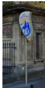
Modèle d'enseigne actuel.

Veuillez agréer, Messieurs les Directeurs, l'expression de nos sentiments distingués.