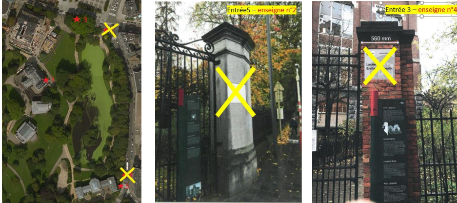
Image aérienne Bing Maps© et Photos extraites du dossier modifiée par la CRMS