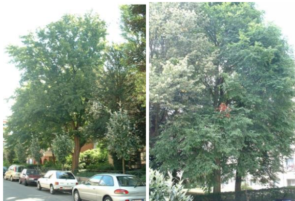
Situation Brugis. Photo de l'érable champêtre (au centre) et de l'orme champêtre (à droite).