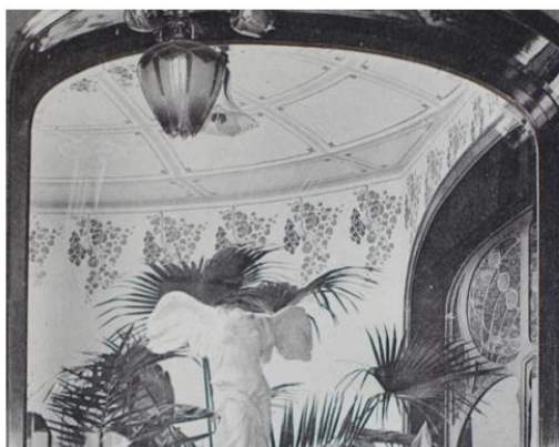
Peinture au pochoir d'origine (Emulation, 1905)