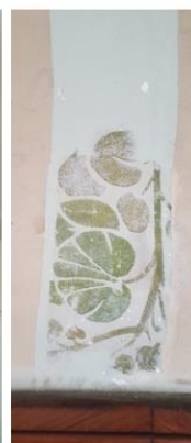
Trace des pochoirs et faux-marbre (2020)