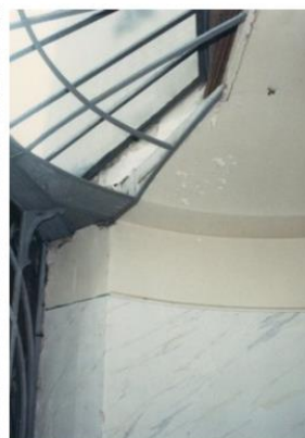
Faux-marbre (Commune -1988)