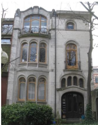
Façade Ouest (jardin)