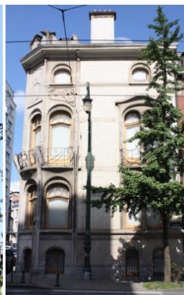
Façade Est (Av Brugmann)