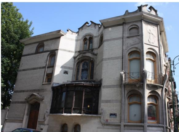
Façade Sud (Av de la Jonction)