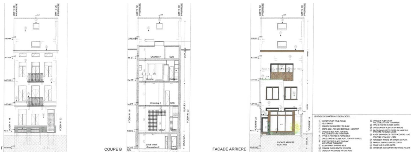
Façade avant, coupe et façade arrière projetées (extr. du dossier de demande)