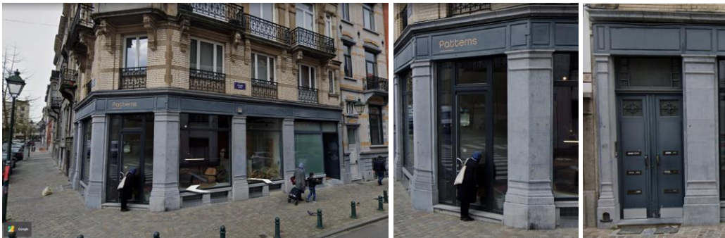
Plans de la situation de droit et projetée joints à la demande et détail des devantures et des portes

La CRMS rend un avis favorable sur la mise en conformité des lucarnes et des menuiseries de l'entresol, qui s'inscrivent adéquatement à la composition des façades.