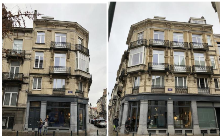
Façades rue Américaine, 40 à droite et Africaine, 62 à droite

La demande concerne l'immeuble de style éclectique datant de 1907, qui occupe l'angle de la rue Américaine, 40 avec la rue Africaine, 62. La maison est comprise dans la zone de protection de la maison Horta, sise 25 rue Américaine ainsi que dans la zone tampon Unesco délimitée autour de ce bien reconnu comme Patrimoine mondial. Elle est reprise à l'Inventaire et se trouve en ZICHEE au PRAS ainsi que dans le périmètre du RCUZ « quartier de l'Hôtel de Ville ».