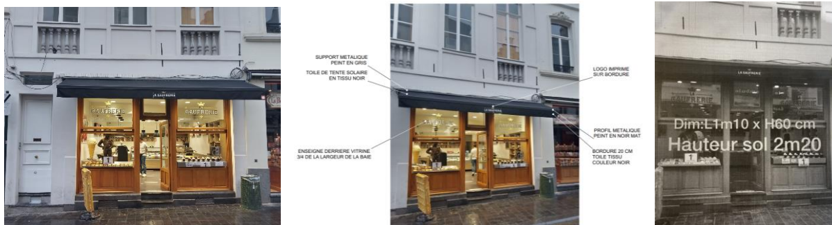
Extraits du dossier

La présente demande vise à régulariser l'installation de trois enseignes et d'une tente solaire.