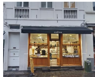
Devanture après travaux (extrait du dossier)

L'arrêté du Gouvernement de la Région de Bruxelles-Capitale du 9/11/2003 classe comme ensemble certaines parties des immeubles sis rue de l'Etuve, 43-45, 47, 49-51, 53 à Bruxelles. Le classement porte plus particulièrement sur les façades avant et arrière, les toitures, les structures portantes, les caves, les murs mitoyens, les planchers d'origine, les cours et arrière-maisons des immeubles en question.