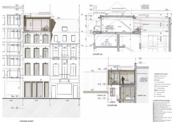
Projet : façade avant, coupe et façade arrière - Documents extraits du dossier de demande